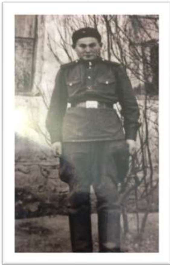
Служба в армии