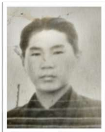
Студент Иркутского медицинского института