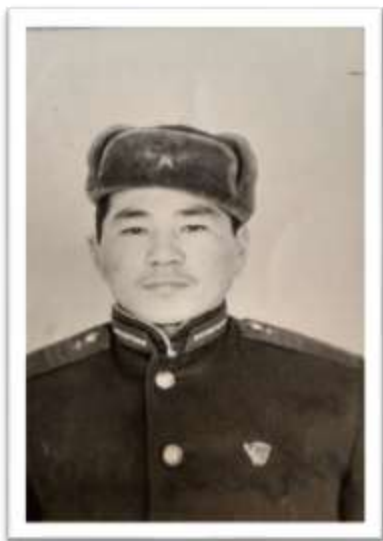
Служба в Советской армии