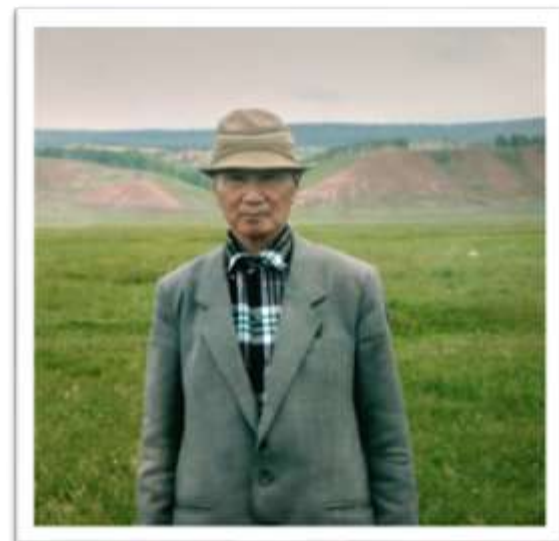
На заслуженном отдыхе