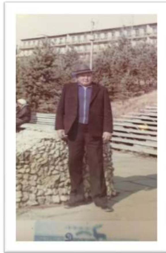
Управляющий первым отделением Совхоза «Бильчирский»