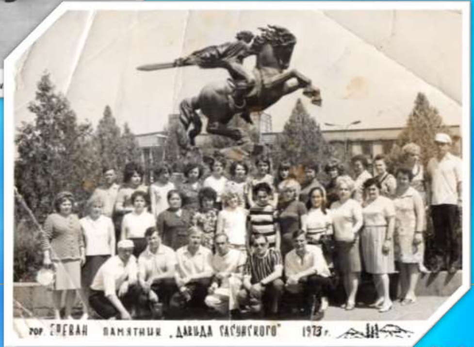
ГОР. ЕРЕВАН ПАМЯТНИК «ДАВИДА САСУНСКОГО» 1973 г.