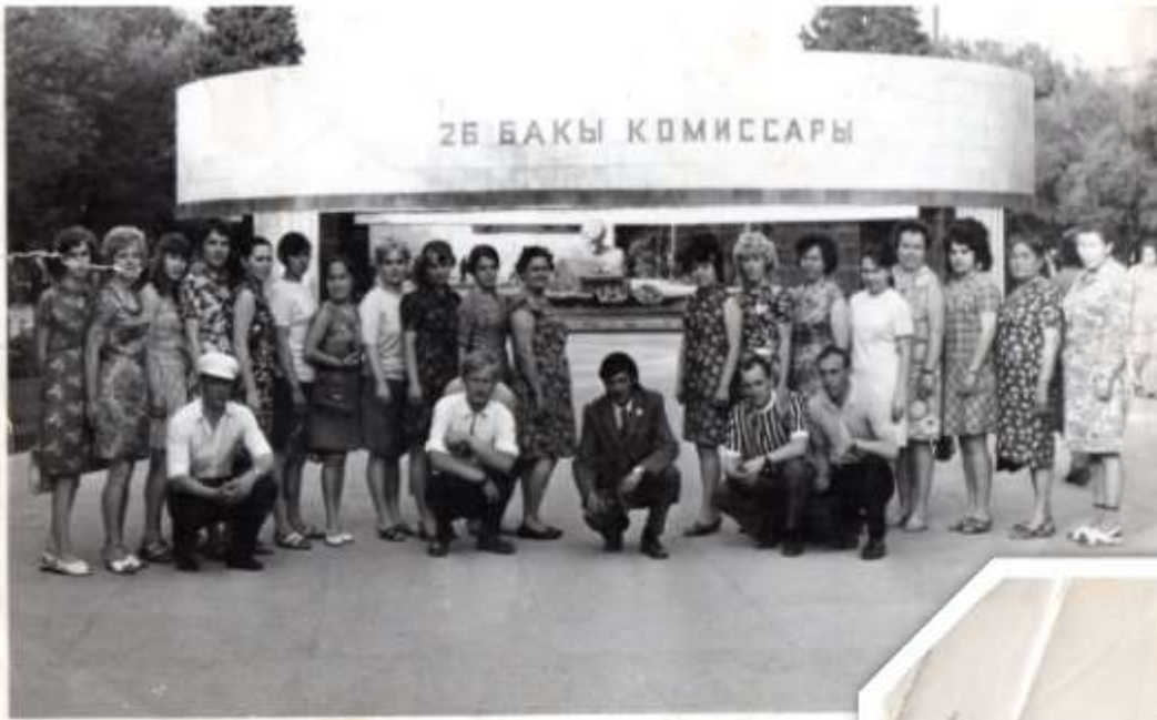
СОЮЗ Младшей 26 бакинских комиссаров